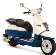
Ocean Blue Milky White