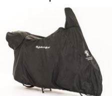
Plachta na skútr