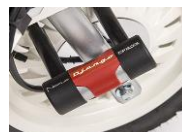
Zámek TOP Block