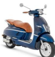
Deep Ocean Blue