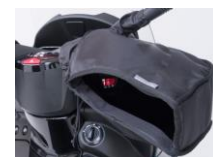
Návleky na ruce