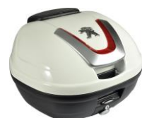
34l kufr lakovaný s opěrkou