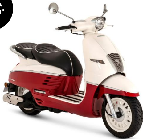
Dragon Red / Milky White